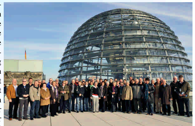
Siegen-Wittgensteiner Bundestags-Besucher auf dem Dach des Reichstags: In diesem Jahr konnte Volkmar Klein schon über 500 Gäste aus dem Wahlkreis in Berlin begrüßen. Leider ist die Kuppel jetzt aus Sicherheitsgründen geschlossen.