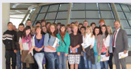
Eine Klasse der Realschule Bad Berleburg zu Besuch in Berlin. Volkmars Klein redet gerne mit Schulklassen und kommt auch gerne in Schulen des Wahlkreises.

Weihnachtsmärkte, 125 Jahre Jubiläum AdH Weidenau, Apollo-Theater, Weikonvent, Volkstrauertag an Kreisgedenksstätte Gosenbach, Amtseinführung neuer CVJM-Kreismitarbeiter, Bundeswehrverwaltung, Gewerbegebietsgespräche, viele einzelne Telefonate, Besuche bei verschiedenen Firmen: Trotz zahlreicher Berliner Termine ist Volkmars Klein viel im Kreis unterwegs und im Gespräch.