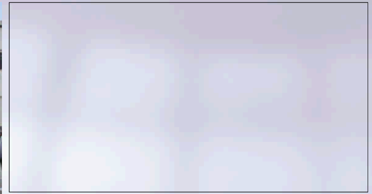
Aus Siegen zu Besuch in der Bundeshauptstadt: Die Klasse 10d der